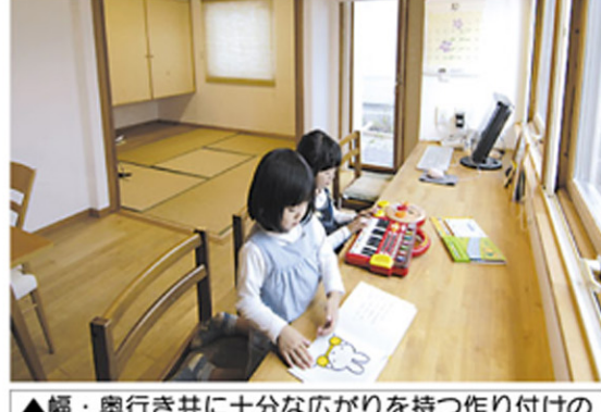
▲幅・奥行き共に十分な広がりを持つ作り付けのデスクコーナー。子どもたちの遊びや勉強、夫妻のパソコン・読書に大活躍