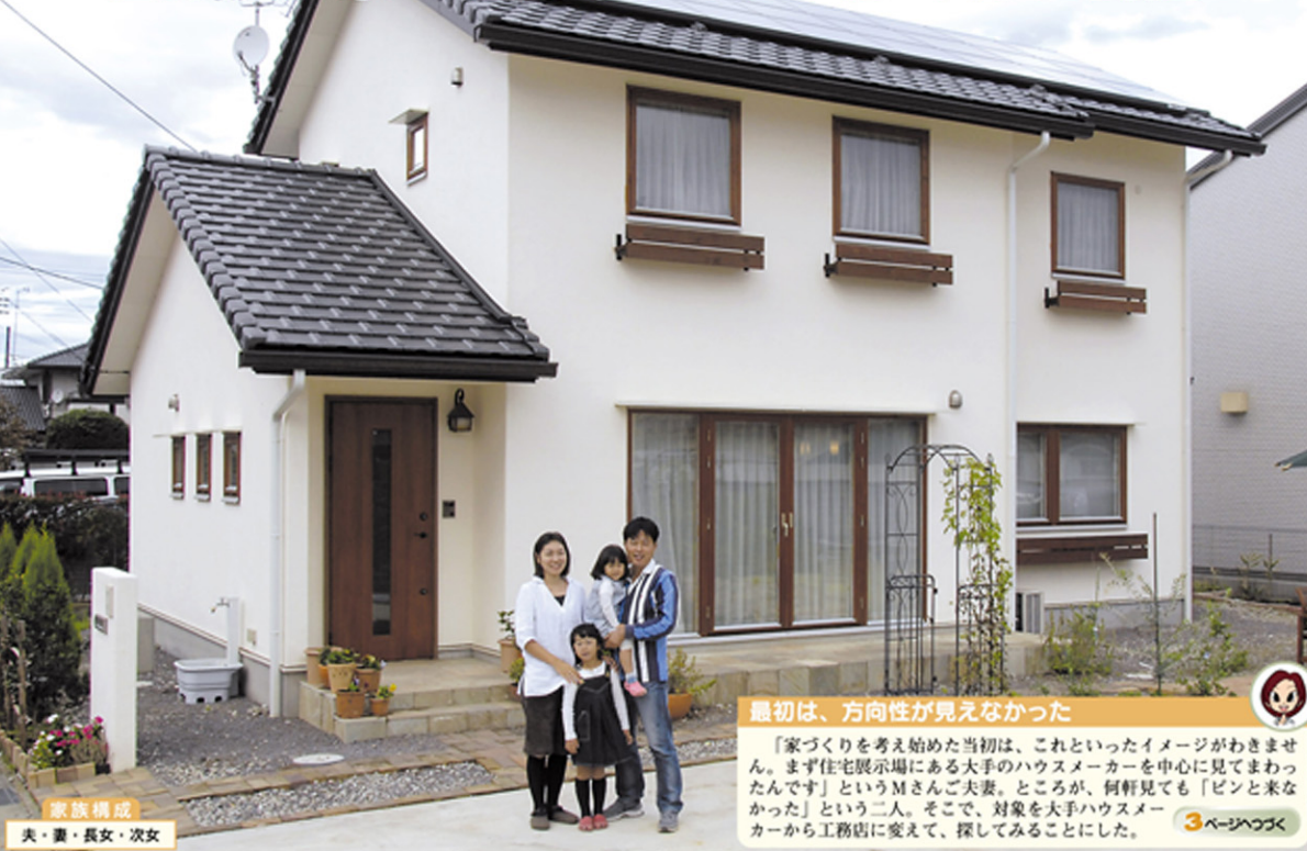
最初は、方向性が見えなかった

「家づくりを考え始めた当初は、これといったイメージがわきません。まず住宅展示場にある大手のハウスメーカーを中心に見てまわったんです」というMさんご夫妻。ところが、何軒見ても「ピンと来なかった」という二人。そこで、対象を大手ハウスメーカーから工務店に変えて、探してみることにした。