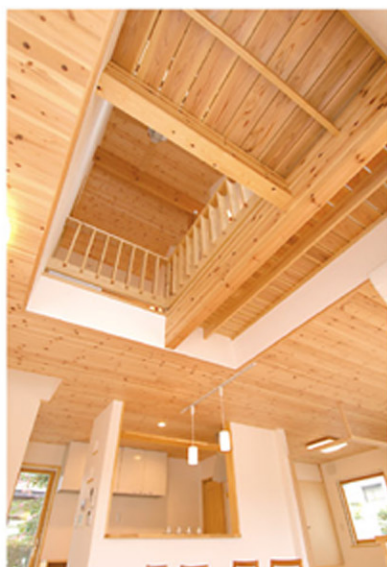
▲リビングのほぼ真ん中付近には、コンパクトながらも採光性に優れた吹き抜けをレイアウト