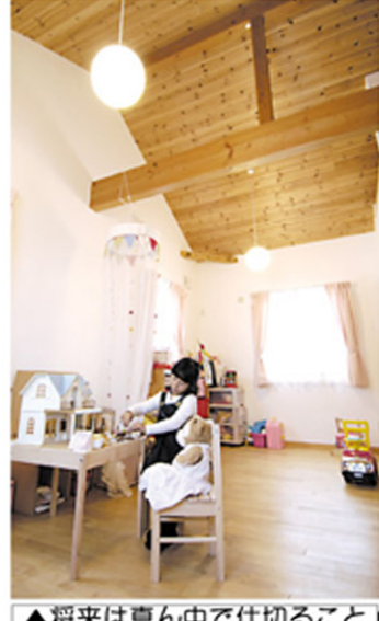
▲将来は真ん中で仕切れることを想定したつくりのキッズルーム。勾配天井で開放感たっぷり

こと。夜間に電源を入れておけば朝から暖かく、日中は電源を切っておいても高断熱・高気密だから余熱で十分に暖かい。冬でもエアコンは必要ないですね。以前は古い鉄筋コンクリートの官舎住まいでしたから、寒さが厳しかった。今は快適です」とご主人。